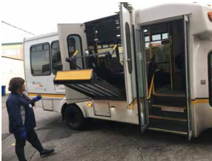
PACE 無障礙多功能交通車

PACE(Programs of All-inclusive Care for the Elderly) 是 1970 年代，舊金山唐人街“安樂居”發展出來的整合照顧計畫，以 Medicare 與 Medicaid 納入給付範圍內，整合服務透過日托服務中心來協調，以全方位跨領域團隊提供居家或社區日間照顧服務，論人計酬。目前全美國有 122 家，分布 31 個州，超過 3 萬名受益者(服務 4% - 5% 的長照需求人口)。台灣在 2016 年新政府執政推動長照 2.0，以社區整體照顧體系推動台灣長照服務，也以 PACE 為參考，但台灣的長照服務以社會模式發展，透過「社區整合型服務中心」、「複合型服務中心」及「巷弄長照站」等三種不同規模型態的據點，建