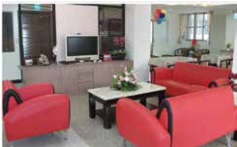
日照中心客廳交誼廳

老盟長期關心老人長期照顧服務的推展，因看見民眾和社區的需要，於 97 年起開始透過公彩補助，推動日間照顧擴點輔導，促進日間照顧中心設立，經老盟統計至 106 年底全臺共有 252 家日間照顧中心，其中 169 家曾接受老盟輔導。因行政院在 105 年通過「長期照顧十年計畫 2.0」，日間照顧服務成為政府推動長照服務重要的一環，因此 106 年度成立的日照中心就有 50 家之多，擴點速度相較於歷年攀升不少，但距離一鄉鎮一日照的目標仍有相當大的距離。而且相較於日本已有 44,000 家日照中心，且能針對重度失能者提供照顧，並持續開創新型態的日照服務，可見台灣日照服務的質與量都仍待提升，需持續推動日照佈點外，亦需依使用者需求的不同，規劃不同類型的日照服務，例如：失智型、身障型、共生型、代間共融型、療養型、復健型…等，開創出日照中心的多元風貌，提供給失能 / 失智者量身打造的長照服務，讓即使是重度的長輩也可依需求選擇日照特色及服務，真正達到在地老化的目標。