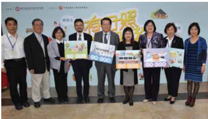
舉辦日間照顧十年國際研討會，政府與民間共同展望日照發展

這些失能或失智長輩的日常，提起時總有道不盡的辛酸！子女們忙著上班，工作家庭蠟燭兩頭燒、疲於奔命，面臨到無人可協助照顧長輩生活的景況；被照顧壓力壓得喘不過氣的生活，已是許多家庭目前遭遇的窘境。這些情形或許你並不陌生，也曾在生活周遭看到，可能還會是你我未來可能面臨到的難題。照顧，已不再只是一個人或一群人的事，而是社區共同的事。