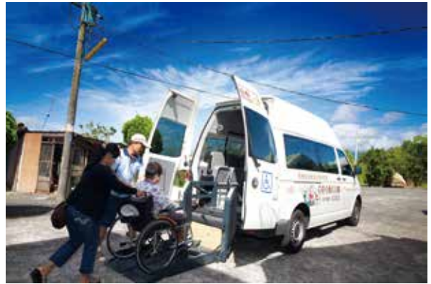
偏鄉交通接送服務